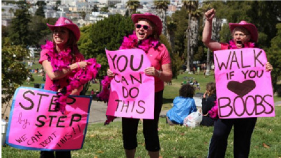
L'industrie du ruban rose , de Léa Pool

Mise à jour le mercredi 11 janvier 2012 à 11 h 19 HNP